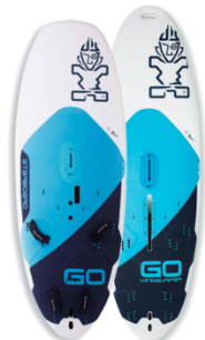
GO GO WINDSURFER

スターボードの象徴的なボードでもある GO は、何千人ものウインドサーファーの上達を支え続けてきた。安定感のあるボリュームバランスに加え、アップウインド性能や、グライド性能も高く、上達のサポートをしてくれるボード。