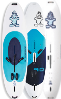
RHINO STARLITE XL

スターボードのエントリーレベルのボードである。ストレートなアウトラインがアップウインドでのドライブを可能とし、初日してウインドサーフィン ビギナーを、成功へと導いてくれる。