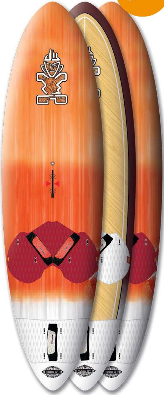
Kode FreeWave Carbon Kode FreeWave Wood Reflex Kode FreeWave Technora